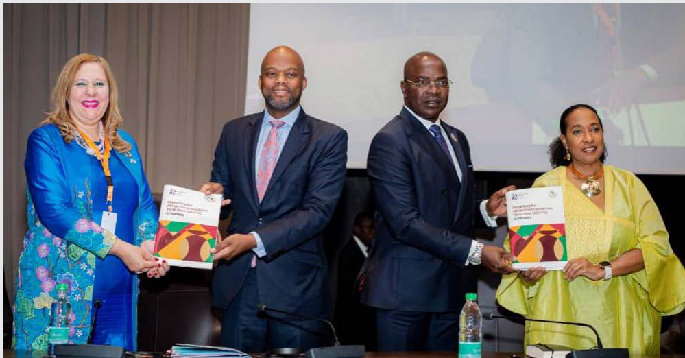
Niamey, Niger. 25 novembre 2022. Zlecaf. Lancement des rapports de cartographie du secteur privé en marge du Sommet extraordinaire de l'UA sur l'industrialisation et la diversification économique.

Lire plus sur tous ces sujets et découvrez plus d'informations sur notre site web www.zlecaf.news