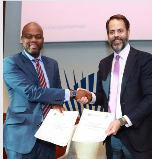
Washington, DC. États-Unis. 13 décembre 2022. Sommet des dirigeants États-Unis - Afrique. Signature d'un protocole d'accord avec le Centre d'affaires États-Unis-Afrique de la Chambre de commerce des États-Unis pour promouvoir le commerce et créer de meilleurs environnements commerciaux en Afrique et aux États-Unis.