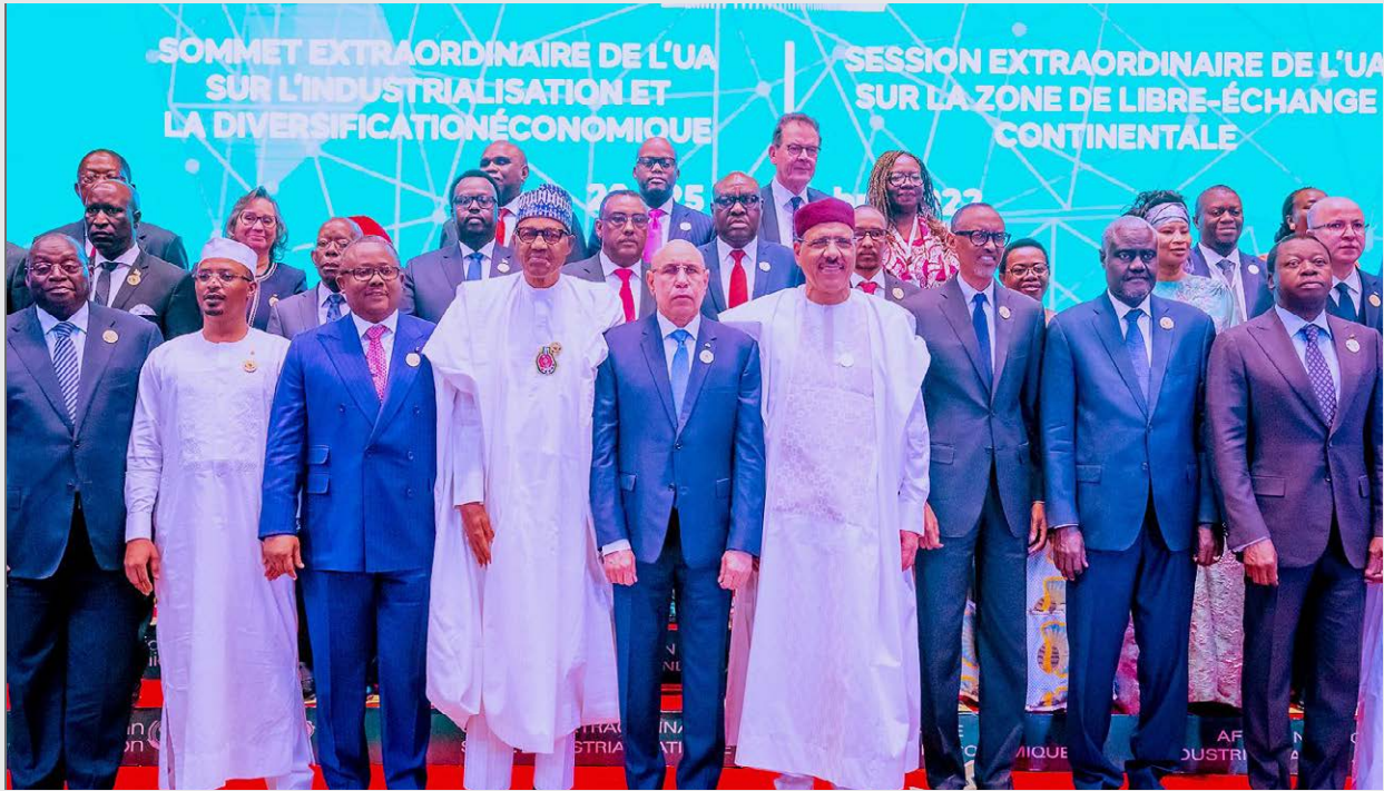
Niamey, Niger. 25 Novembre 2022. 17e Sommet extraordinaire de l'UA et Session extraordinaire de l'Union Africaine sur la Zone de libre échange continentale africaine.